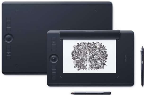
Abgebildete Produkte: Wacom Intuos Pro L & Wacom Intuos Pro Paper Edition M. Künstlerin: Mouni Feddag

Das Wacom Intuos Pro bietet dir die ultimative Kontrolle über deine Kreationen. Dank des drucksensitiven Wacom Pro Pen 2 und des schlanken Tablett-Designs kannst du in ungeahnter Detailtreue zeichnen. Bei der Arbeit mit der Wacom Intuos Pro Paper Edition hast du außerdem die Möglichkeit, mit dem Wacom Finetip Pen auf deinem Lieblingpapier Zeichnungen in Tinte anzufertigen und diese anschließend in digitale Dateien umzuwandeln – um sie dann in der Software deiner Wahl bearbeiten zu können.